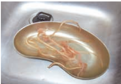
Figura 4. Ascariidiosi massiva in bambino recentemente immigrato dal Bangladesh (osservazione personale).