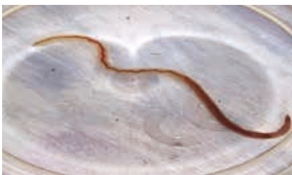
Figura 5. Anellide , che giunge all'acqua del WC dai tubi di scarico, talvolta misdiagnosticato quale ascariide eliminato con le feci (osservazione personale).

so centrale. Diverse le modalità patogenetiche: trasmissione interumana fecale-orale di uova oppure nel paziente teniosico schiusura delle stesse nell'intestino o autoreinfestazione. Diagnosi attraverso le diverse tecniche di imaging e la ricerca di anticorpi su siero o su liquor. Ovviamente negativo l'EPF. Terapia con albendazolo o praziquantel (non in commercio in Italia). 2