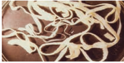
Figura 2. Tenia saginata emessa dopo terapia con scolice indicato dalla freccia (osservazione personale).

Nei casi con recidive molto frequenti, nei quali riveste probabilmente un ruolo significativo una predisposizione su base genetica, può essere utile un ciclo di 5 somministrazioni dell'antelmintico a distanza di 15 giorni ed è d'altra parte importante attenersi a norme igieniche elementari volte a ridurre il rischio di autoreinfestazione, quali il frequente cambio e lavaggio a caldo (>60°C) della biancheria intima e delle lenzuola nonché l'igiene delle